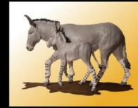
Chantal Gasquet sculpture animale du 2 au 30 septembre 2023